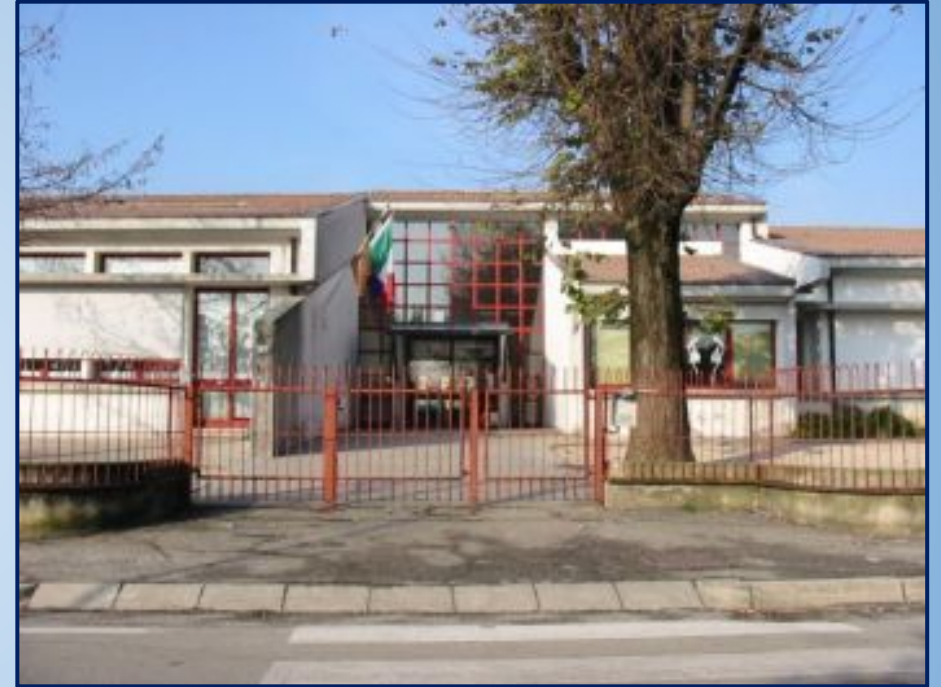
“LEONARDO DA VINCI” Via Ramusa,71 Paviola (Pd) tel 049/5996748