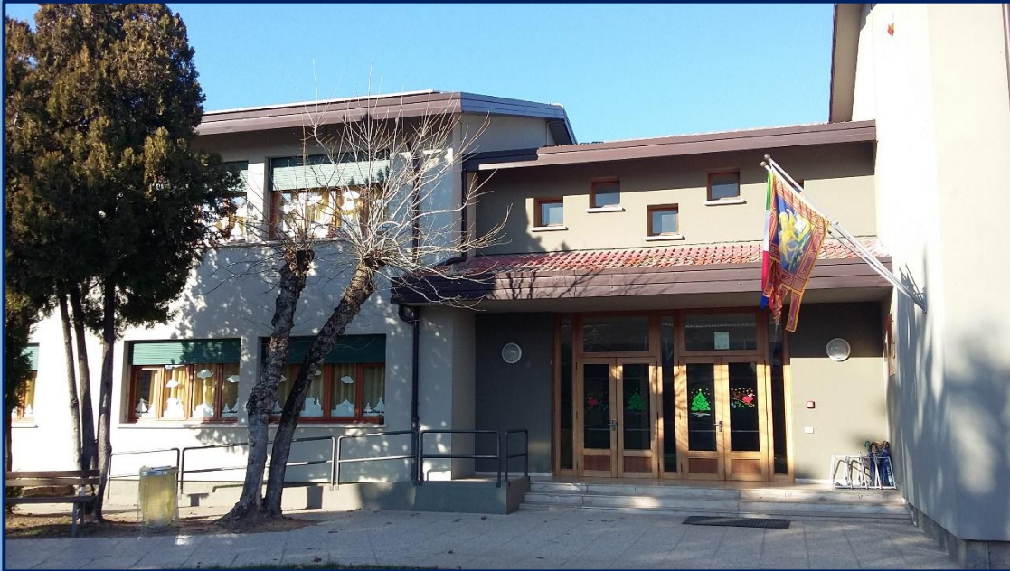
“DANTE ALIGHIERI” Vic. Giovanni XXIII San Giorgio in Bosco (PD) tel.049/9450882